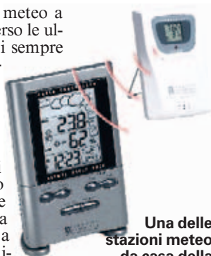
Una delle stazioni meteo da casa della Oregon Scientific: si parte da meno di cento euro per non sbagliare mai abbigliamento

Se non hai una stazione meteo a portata di mano e ti sei perso le ultime previsioni in tv, puoi sempre avvalerti della rete per sapere tutto su che tempo farà domani. Nella tua zona, in Italia, in tutto il mondo, perché si sa: il world wide web non conosce frontiere. Molti siti di quotidiani italiani hanno una sezione dedicata alle previsioni del tempo, ma potete affidarvi anche a MeteoLive ( http://meteolive.leonardo.it/ ), il primo quotidiano in rete dedicato alla meteorologia. A gestirlo è la Meteo Italia srl , alla quale si affidano Sky, Il Sole 24h, la Rai e perfino la Ferrari e